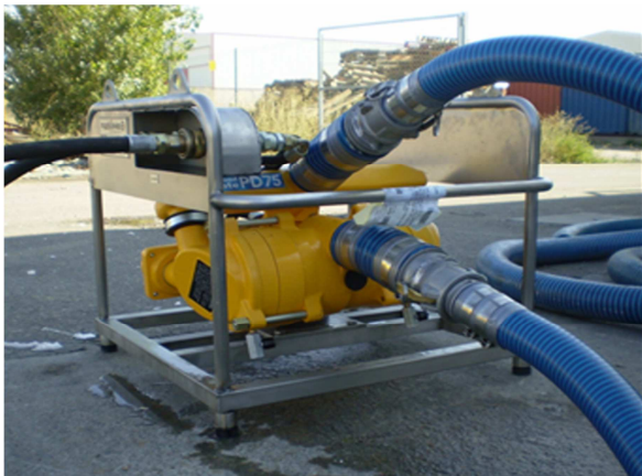
Selwood PD75 Spate sa hidrauličkim motorom

Spate PD75 se isporučuje sa Yanmar dizel motorom na konstrukciji s kotačima, ili sa hidrauličkim motorom na konstrukciji bez kotača.