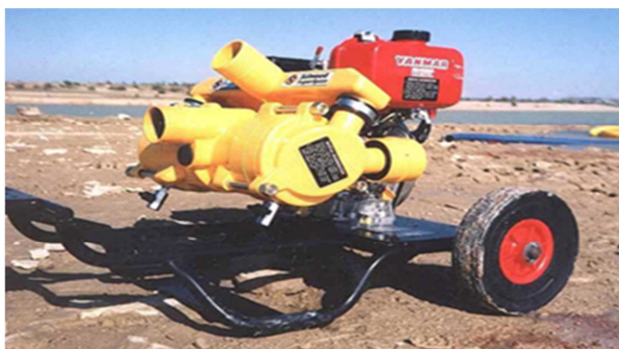
Selwood PD75 Spate sa dizel motorom