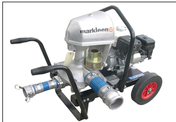
Selwood PD50 Simplite sa naftnim motorom